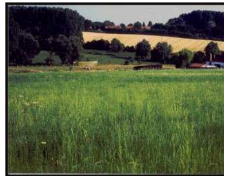
Vue extérieure de la brasserie