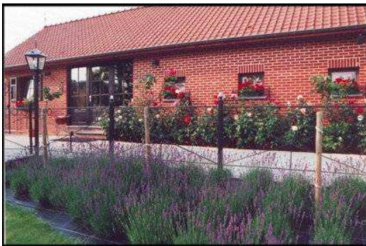
Vue extérieur de la brasserie